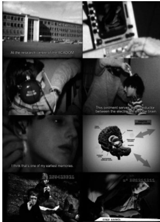
Stills uit Promotional Film Concerning the Archiving of Other People's Memories , single channel video, 8 mm overgezet op dvd, 5 minuten, 2006 © Jasper Rigole.

bedrieglijk en toch dwingend, machtig en vaag. Men kan geen staat maken op zijn herinneringen, en toch bestaat er geen andere werkelijkheid dan degene, die we in ons geheugen dragen”, zoals Klaus Mann het in het autobiografische Het keerpunt (1942) verwoordde.