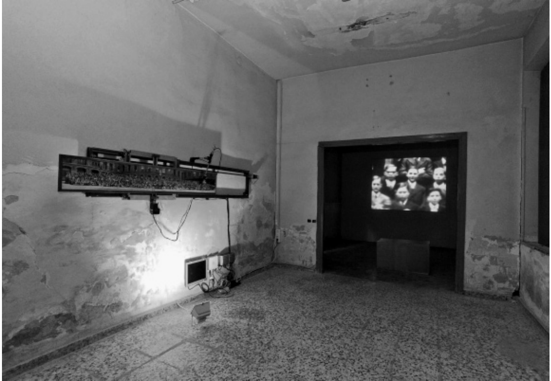
Installatiebeeld van Outnumbered, A Brief History of Imposture tijdens Manifesta 8, Murcia, 2010. Technische realisatie: Gert Aertsen (lahaag.org), constructie: Ian Ghyselink, programmering: Jan Willem de Haan, vertelstem: Richard Wells. Met de steun van AON, HISK & KASK © Jasper Rigole.

teren door er beschrijvingen aan toe te voegen. De onlinedatabase wordt tegelijk een sociaal-cultureel platform, een verzameling van reële ficties en een mediakunstwerk.