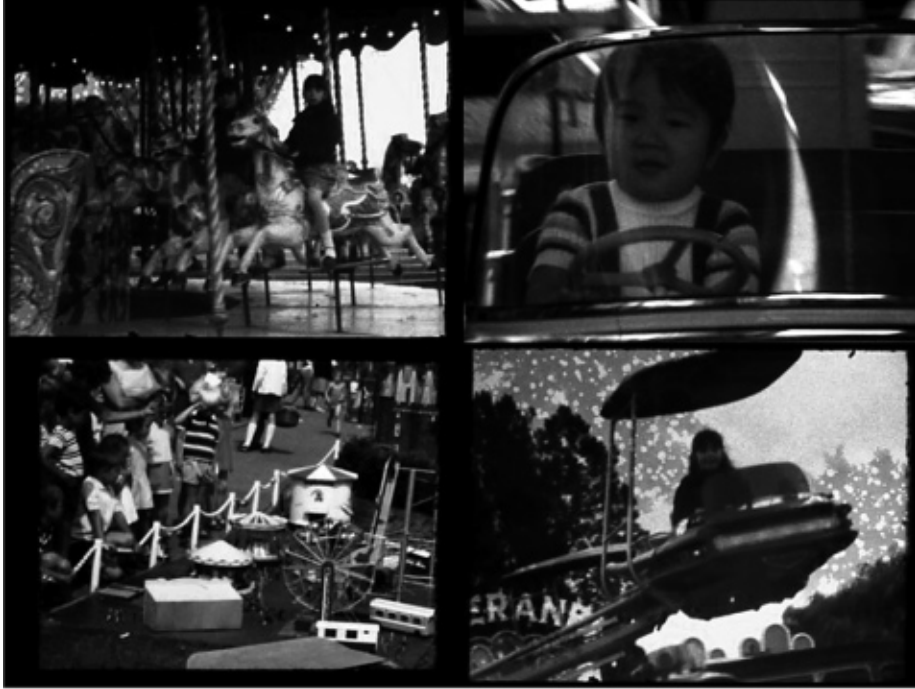
Stills uit Attraction , installatie, 8 mm-film overgezet op 16 mm, drie Kodak-carrouzels , 2013 © Jasper Rigole.