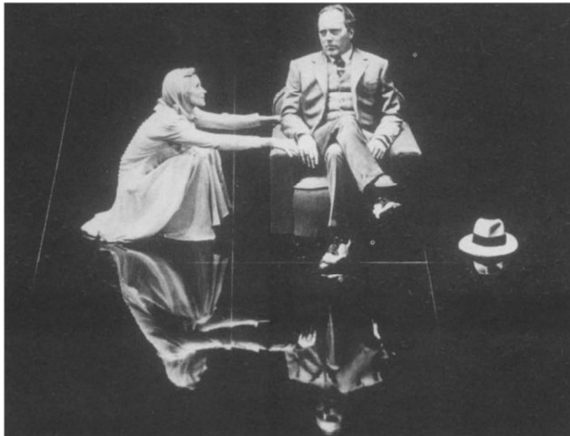
„Fernando Krapp heeft mij deze brief geschreven” door KVS-Brussel (1993) - Foto Leo van Velzen.