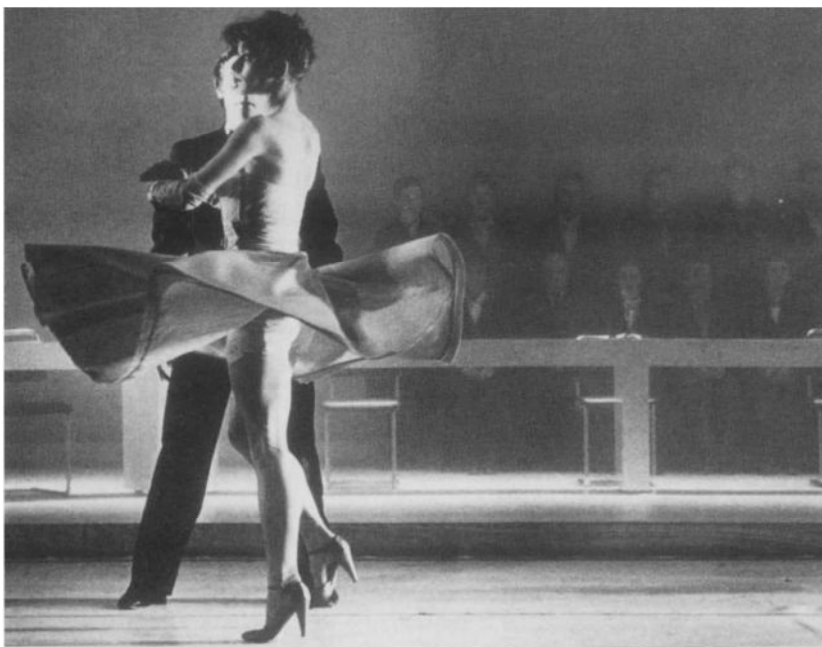
„Wasteland” door het Ro-Theater (1980)

Bij Grotowski liep hij, zoon van een advocaat, „de eerste scheuren in mijn burgerlijk Vlaamse ziel” op. Hij leerde er in zichzelf af te dalen, tot de lagen van het onderbewustzijn. Hij kreeg er inzicht in de functie van de regisseur en diens relatie met de acteurs. In hen wil hij partners ontmoeten die, in een proces van zelfonthulling, uit zichzelf het materiaal te voorschijn halen, de tekens, signalen, metaforen, waarmee een voorstelling kan worden opge-