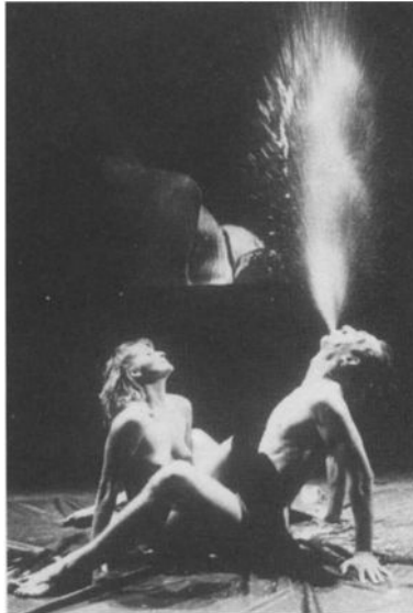
„Bataille/bataille” door Noord Nederlands Toneel Groningen (1992)