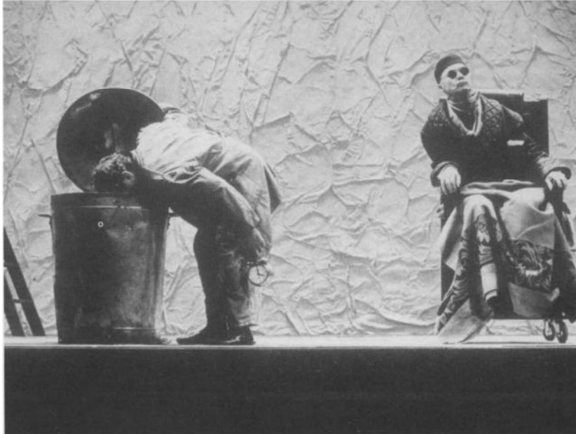
„Eindspel” door de KVS-Brussel (1991) - Foto Leo van Velzen.

van teksten geen historische reconstructie maar een onderzoek van de „condition humaine”. Intussen is bij hem de overtuiging gegroeid dat het gesproken toneel in onze tijd een bijzondere opdracht heeft als behoeder van de taalcultuur, nu de taal, mede door de vervlakkende invloed van de elektronische media, als instrument van het denken wordt bedreigd.