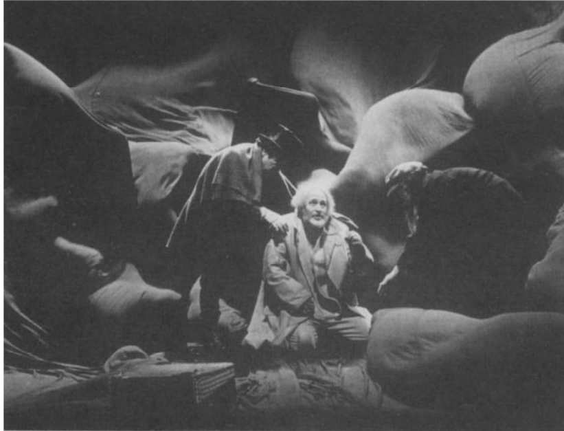
„Koning Lear” door het NTG (1987) - Foto Leo van Velzen.

bouwd. De acteur is de spil van het spel. Op het toneel moet hij niet „doen als-of”, niet „vertonen” maar „tonen”.