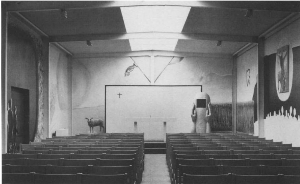
Het werk van Roger Raveel in de „Bidplaats Maria hulp der Christenen” in Machelen aan de Leie

Dan volgt een afbeelding van het Gestolde Bloed, een vierkante donkerrode kleurpartij waar bovenaan een grijswitte vlek een eventuele sentimentaliteit moet doorbreken. Tenslotte, bij de uitgang, een schilderij dat de prediking voorstelt: een haast anonieme figuur achter een spreekgestoelte met op de voorgrond typische Raveelfiguren die symbool staan voor ieder individu; vanuit dit tafereel vertrekt dan een blauwzwarte klimmende lijn naar de uitgang.