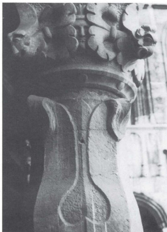
Een van de „Indiaanse” kapitelen in het eerste binnenhof van het prinsbisschoppelijk paleis te Luik.

Op twee andere plaatsen in de Nederlanden bevond zich in deze periode aantoonbare belangstelling voor Indiaanse kunstvoorwerpen. In de nalatenschap van Filips van Bourgondië, bisschop van Utrecht, vinden we in Slot Duurstede Twaelf plumaigen van blauw wit rood ende geluwe verwen . De inventaris van deze nalatenschap werd opgesteld in februari 1529, vijf jaar na het overlijden van de bisschop. In de nazomer van 1521 bevond Filips zich aan het hof van Karel V in Brussel en het is dus mo-