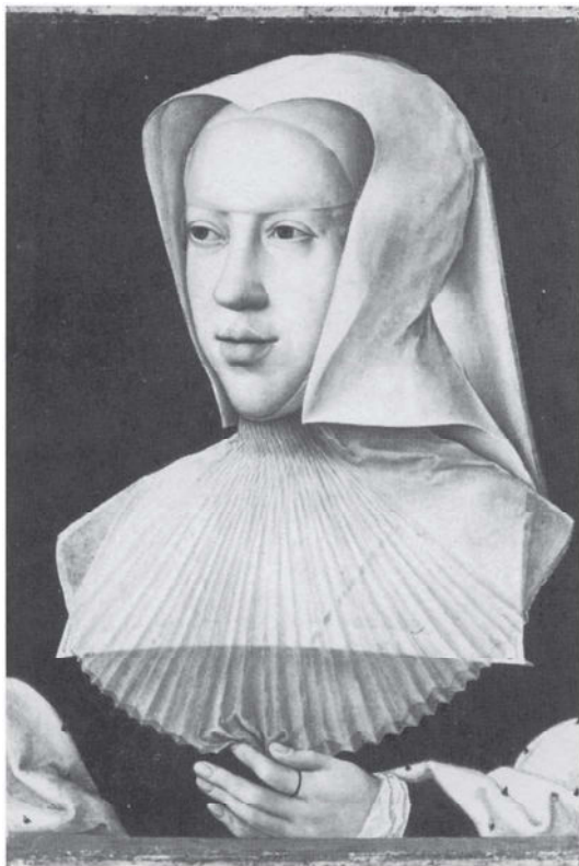
Portret van Margaretha van Oostenrijk als jonge weduwe. Toegeschreven aan Bern. van Orley.

pen aan zijn bonne Tante et plus que mère , Margaretha van Oostenrijk, die er haar goed voorziene bibliotheek in haar hof te Mechelen mee opsierde. We kunnen stellen dat zij daarmee het eerste Aztees museum in Europa schiep.