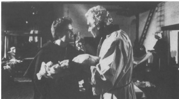
Zeno, hoofdfiguur uit de film „L'œuvre au noir” van A. Delvaux, vertolkt door Gian Maria Volonte.