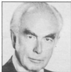
MARTEN TOONDER werd geboren in 1912 te Rotterdam. Publiceerde 40 delen in de serie Literaire Reuzenpockets , behandelende de lotgevallen van Olivier B. Bommel.

Maar mijn broer vatte genegenheid op voor die oude pop, en gaf hem daardoor een karakter. Het werd een vriendelijke, wat gezapige, bejaarde beer die in een omgekeerd voetenbankje woonde - een verhoginkje dus, waarvan de poten als pilaren omhoog staken.