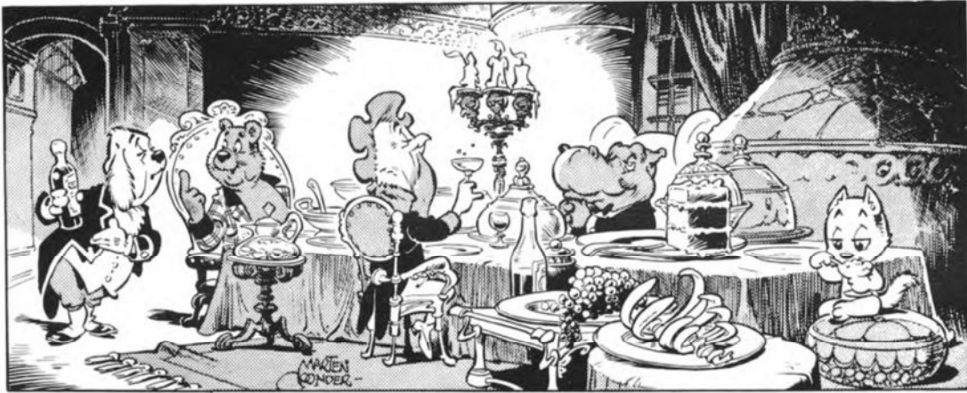
De eenvoudige doch voedzame maaltijd aan het slot.

ook niet meer; integendeel - soms gaven ze me het prettige gevoel, dat de ontmoeting met een geestverwant oproept. En dat heeft men nodig, wanneer men met een geheimzinnige figuur als heer Bommel bezig is, die zelf niet weet wat hij bedoelt.