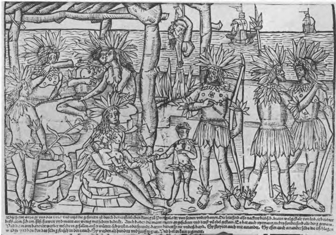
Pluimdragers en menseneters, twee stereotiepen van de Indianen op een Duitse houtsnede uit 1505.

meer sceptisch over de verovering. Hij spotte met zijn landgenoot kapelaan Barbier, die tot bisschop benoemd werd van Indianen die hij nooit te zien zou krijgen. Het had al evenmin zin dat wie onder de Spanjaarden geboren was over de Indianen zou gaan regeren. Reeds in 1525 viel hij scherp uit tegen de goudzucht en de tirannie van de veroveraars die zich allerminst als christenen gedroegen en in zijn Colloquia zag hij de kruisbanier op de nieuwe eilanden als symbool niet van christianisatie maar van heerszucht. De gouden glans van Amerika zou bij de volgende generatie intellectuelen nog meer terughoudendheid en zelfs een zekere verachting voor het nieuwe continent opwekken. Tegenover zijn tijdgenoten, die zonder maar een letsel op te lopen goud buit maakten op simpele en