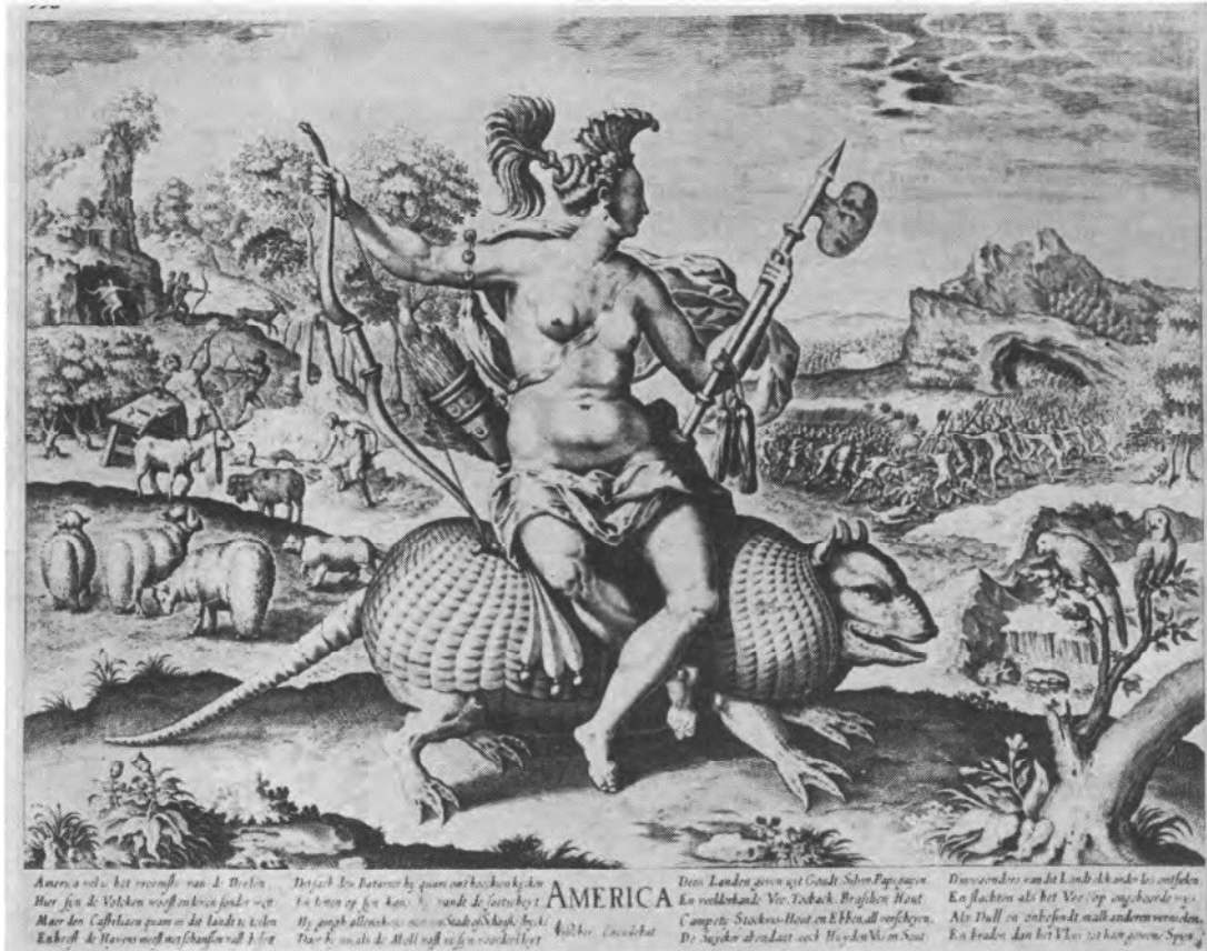
Amerika, allegorie van Cornelis Visscher, circa 1650.