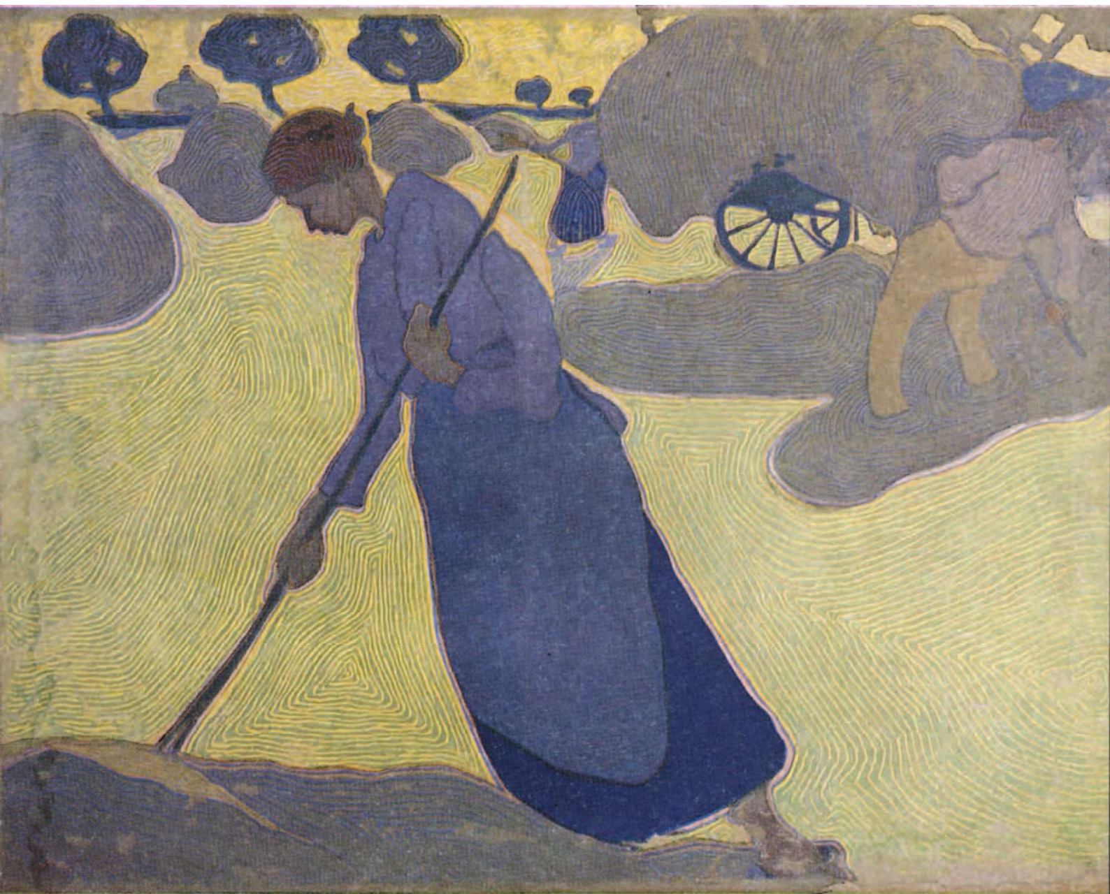
Henry van de Velde: „De oogster“ 1891-1892.