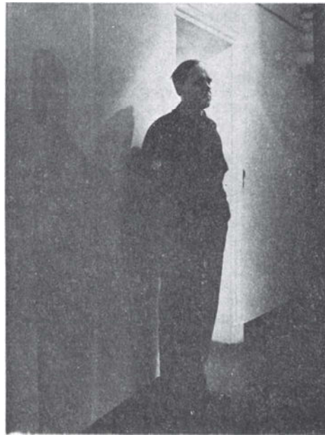
Roger Raveel in de keldergangen te Beervelde.