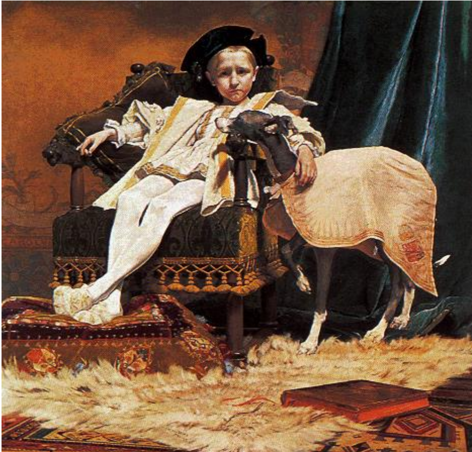
Jan van Beers, 'Keizer Karel als kind', 1879, Kon. Museum voor Schone Kunsten, Antwerpen. Herkenningsbeeld van de tentoonstelling 'Mise-en-scène. Keizer Karel en de verbeelding van de negentiende eeuw' in het Museum voor Schone Kunsten van Gent (1 december 1999-19 maart 2000).