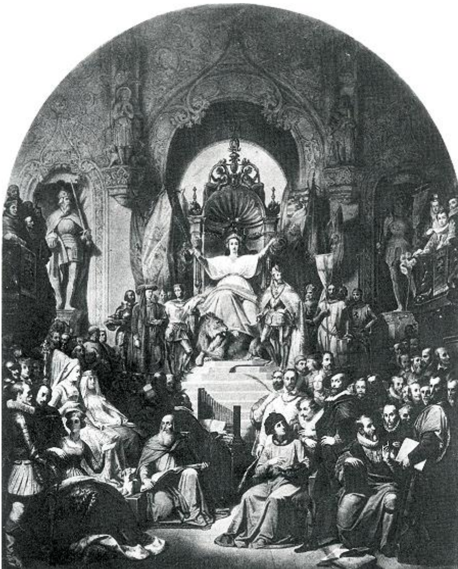
Henri de Caisne, 'België kroont zijn illustere telgen', 1839, Museum voor Schone Kunsten, Brussel. Dit schilderij is wellicht verloren gegaan.

Het spreekt vanzelf dat keizer Karel zijn vaderlandslievende 'landgenoten' met trots vervulde. In zijn lange gedicht Les Belges , dat hij in 1812 publiceerde [p. 644]