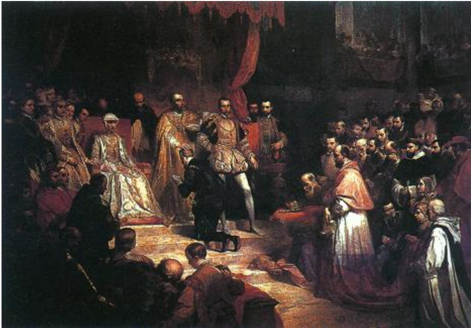
Louis Gallait, 'De troonsafstand van keizer Karel', 1841, Kon. Musea voor Schone Kunsten van België, gedeponereerd en tentoongesteld in het Museum voor Schone Kunsten in Doornik.

Karel een 'eigen' vorst, Filips een 'vreemde' overheerser. De nationaliteit van de vorst bepaalde [p. 646]