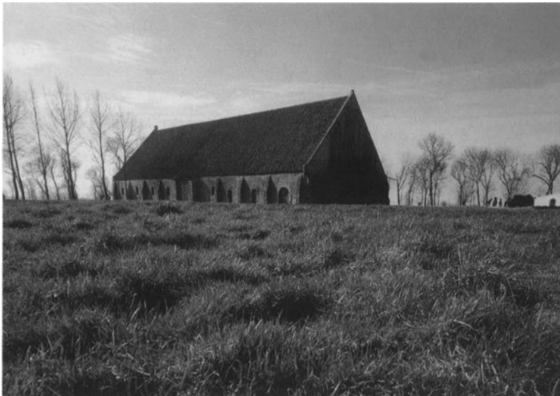
De schuur van Ter Doest in Lissewege, 13de eeuw.

van Ter Duinen worden beschouwd, maar daarvoor moeten we meteen een sprong maken naar 1175. In 1106 reeds was te Lissewege sprake van een kapel Thosan (of Doest) genaamd, die in het bezit was van ridder Lambert van Lissewege. Evrard, bisschop van Doornik, schonk in 1174 deze kapel aan de cisterciënzers, om er een abdij op te richten. In 1175 werden twaalf monniken en drie lekenbroeders door abt Walter I van de Duinenabdij naar Lissewege gestuurd om er een cisterciënzerabdij te bouwen. De Brugeling Haket kan worden beschouwd als de abt-stichter van Ter Doest. Heel interessant is de vaststelling dat de