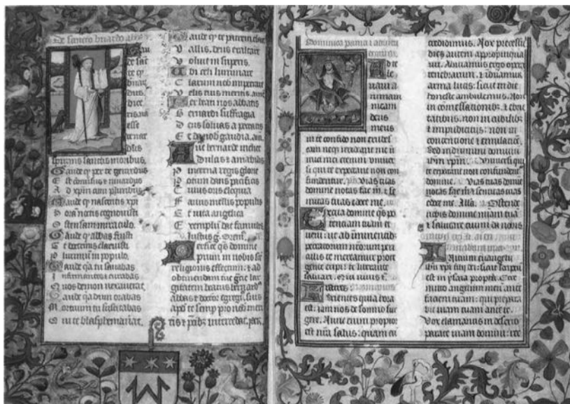
Een cisterciënzermissaal van Ter Doest, ca. 1480.