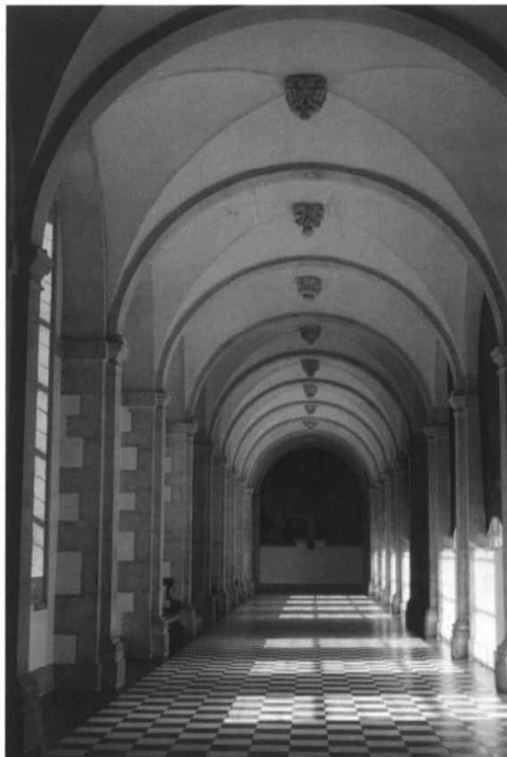
De 17de-eeuwse pandgang van de Duinenabdij nu het bisschoppelijk seminarie van Brugge.

daar bovenop kwam halverwege de eeuw de zwarte pest, die ook binnen de gewijde kloostermuren haar vernietigend werk verrichtte. De hartverscheurende tweestrijd tussen de pausen van Rome en Avignon, het beruchte westers schisma, belette dat ook een religieuze vernieuwing op gang kon worden gebracht. Jan van Hulst, die abt van Ter Doest werd op het einde van de 14de eeuw, speelde een be-