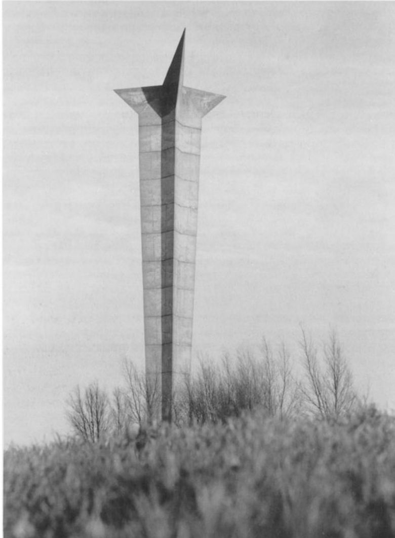
Monument in 1974 op initiatief van de Provincieraad van West-Vlaanderen opgericht in Aalbeke, dicht bij de Belgisch-Franse grens. “Aan de Westvlaamse sjouwers die her en der in eigen land een karig loon verdienden. De grensarbeiders en de seizoenarbeiders, de uitwijkelingen die zich om den brode gedwongen zagen hun land te verlaten. Aan alle Westvlaamse arbeiders die zich met drift bleven verzetten tegen hun onwaardige levenstoestand, en aldus de basis legden van onze welvaart.” Ontwerp: Jacques Moeschal, 1974.