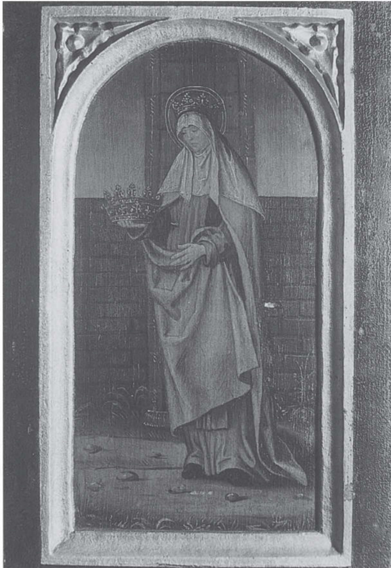
De heilige Elisabeth, patrones van het begijnhof van Champfleury. Gent, Begijnhof van Sint-Amansberg, ca. 1500