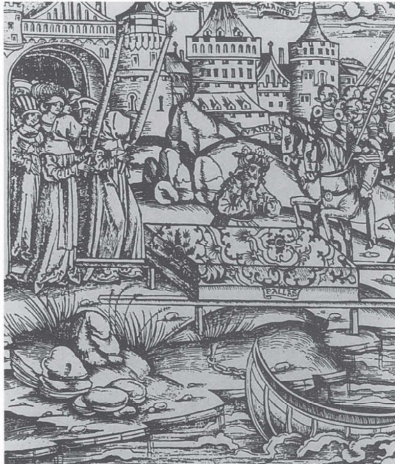
Begijnen openen een begrafenisstoet, begin 16de eeuw. (Uit: J.-Cl. Schmitt, Mort d'une hérésie , Parijs, 1978, pl. 1)

Dowaai, of een commerciële activiteit ontplooiden, bleven onderworpen aan de stedelijke fiscaliteit (38). De begijnen beschikten over een gewone rechtspersoonlijkheid, oefenden het volledige eigendomsrecht over hun bezittingen uit (39), en verschenen als burgers voor de schepenen.