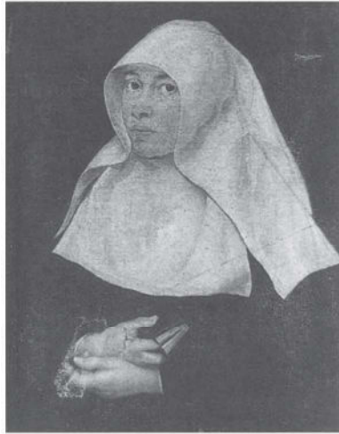
Portret van een begijn, 1651. Leuven, Stedelijk Museum

ten van de stad gehanteerd zijn. Vanwege de wereldlijke autoriteiten was er wellicht weinig of geen aanleiding om in deze uitermate kleine gemeenschappen regulerend op te treden. De stichtingen werden beschouwd als louter private aangelegenheden; de stedelijke overheid greep slechts in indien tussen de erfgenamen van de stichter en de bewoners van het convent een geschil rees (35), of bij andere manifeste problemen van financiële aard (36).