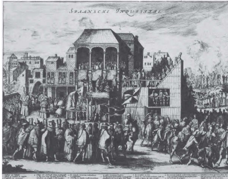
Het spookbeeld van de Spaanse inquisitie.

den. Alhoewel in dit verband nog geen onderzoek werd verricht, kan worden aangenomen dat de onderinquisiteurs zich aan deze richtlijnen hebben gehouden. Uitzondering op deze regel was de inquisiteur voor Vlaanderen, Doornik en het Doornikse en Waals-Vlaanderen: Pieter Titelmans. Deze verklaarde zich als pauselijk inquisiteur in de eerste plaats door het kerkelijk recht gebonden en handelde volgens de inquisitoriale procedure zoals deze door Rome, o.m. via handboeken zoals dat van N. Eymerich - verschenen te Avignon in 1376 en herdrukt te Rome in 1503 - werd opgelegd. Dit had als voornaamste gevolg dat zij die berouw toonden door Titelmans niet aan de wereldlijke autoriteiten werden overgeleverd voor terechtstelling volgens de plakaten, maar integendeel hun dwalingen voor hem als inquisiteur konden afzweren, een lichtere straf kregen en vervolgens werden vrijgelaten. Zijn optreden tegenover de nieuwgezinden was dus ongetwijfeld milder dan wat door de vorstelijke wetgeving voorgeschreven werd. Desondanks is Titelmans de geschiedenis ingegaan als de meest