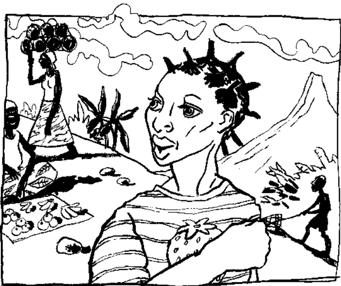
Jeroen Janssen, tekening uit: id., Muzungu. Sluipend gif , Wonderland productions, 1997.