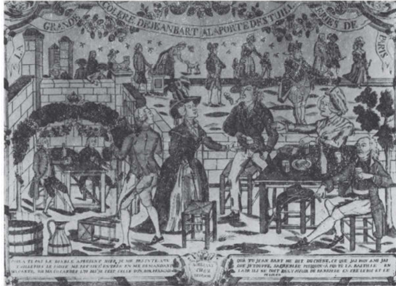
Grande colère de Jean Bart à la Porte de Tuileries. Jean Bart saisi par la Révolution qui exalte le héros populaire au franc-parler et aux idées généreuses.

sance d'une légende de Jean Bart. Mais le contexte seul ne peut servir d'explication exclusive. Le mythe du héros, pour perdurer, a besoin d'être entretenu et diffusé.