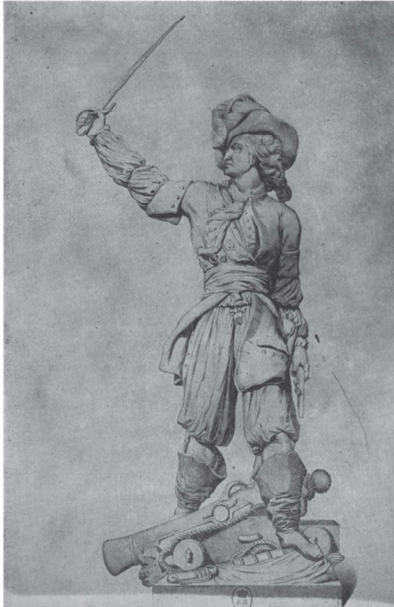
Le relevé de la statue de Jean Bart inaugurée en 1845, œuvre de David d'Angers.