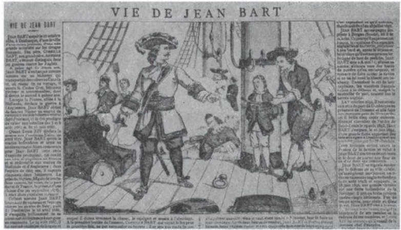
Image d'Épinal et édification morale: Jean Bart père dénaturé ou pédagogue d'un sublime sang-froid?