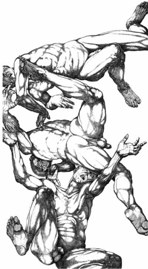
Paul van Dongen, Vallen 3 , 2003, ets, 205 x 110 cm.

hij een weg die bezielt is om te stimuleren tot kijken en deelnemen. Zijn kunst moet iets teweegbrengen. Die werking komt eerst uit de verf die op het doek wordt geborsteld en gesmeten. Van daaruit wordt het motief opgebouwd tot een gevoel ontstaat dat het werk “boven hem uitgegroeid is” 7 , in de euforie van het scheppen.