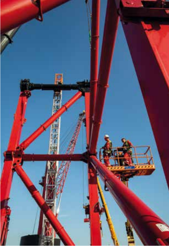
North Sea Port is het nec plus ultra van de Vlaams-Nederlandse samenwerking, vindt Filip D'havé, afgevaardigde van Vlaanderen in Nederland

goede is gekeerd in de Vlaams-Nederlandse samenwerking. “In mijn eerste ambtsperiode tussen 2008 en 2014 zag je dat zowel in Nederland als Vlaanderen aan het eind van de rit de nationale context nog altijd dominant was. Als het samenwerking met de ruggen tegen elkaar is, zie je dat de effectiviteit beperkt is. Nu leeft veel sterker het besef dat we er beiden iets bij te winnen hebben. De opdracht is steeds meer de nationale grens en de nationale kaders te slechten. Je hoeft niet samen te werken met de burens om de mooie ogen, maar om het welbegrepen, gedeelde eigenbelang.”